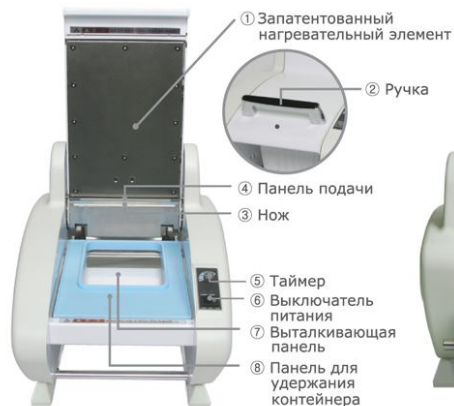
Серия СТР 3 Вид спереди